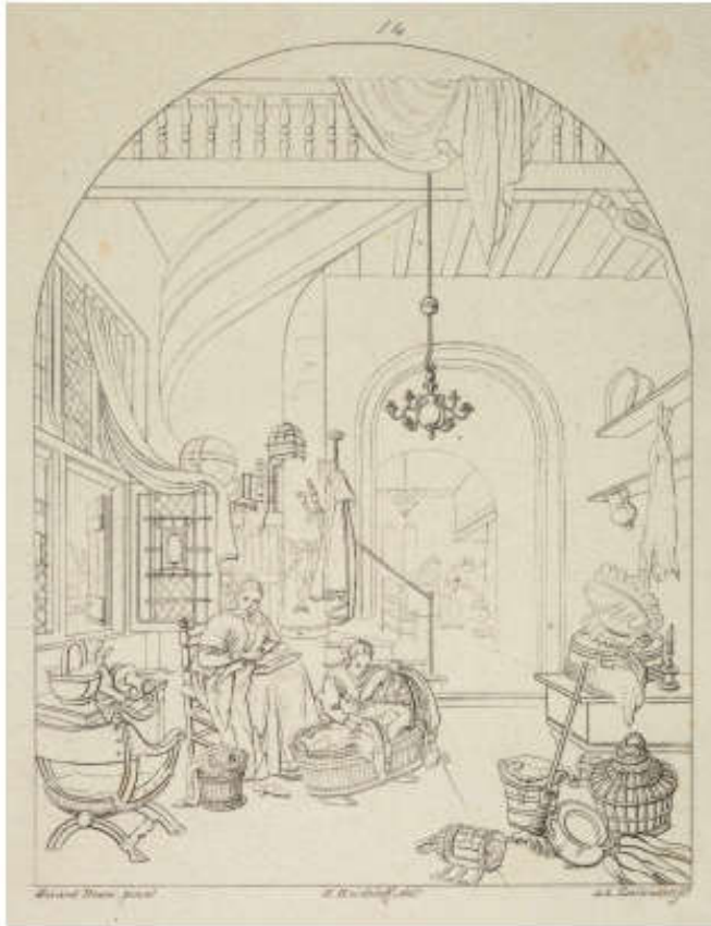
reproductieprint van Gerard Dou's De jonge moeder (1658)