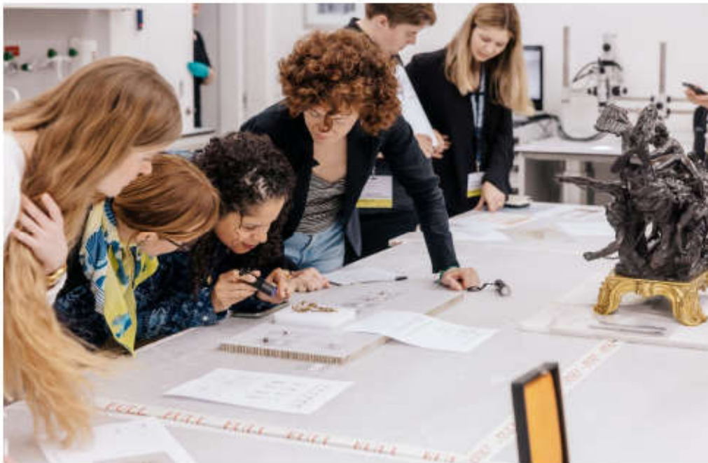
deelnemers aan het eerste Biennial Summer Institute for Netherlandish Art , 2023

Het op weg helpen van aankomende professionals op het gebied van Nederlandse kunst past bij de prioriteiten van de Vrienden. Daarnaast sluit het Biennial aan bij de missie van het RKD: wereldwijd toegang bieden tot kennis, onderzoek en informatie over Nederlandse kunst in internationale context.