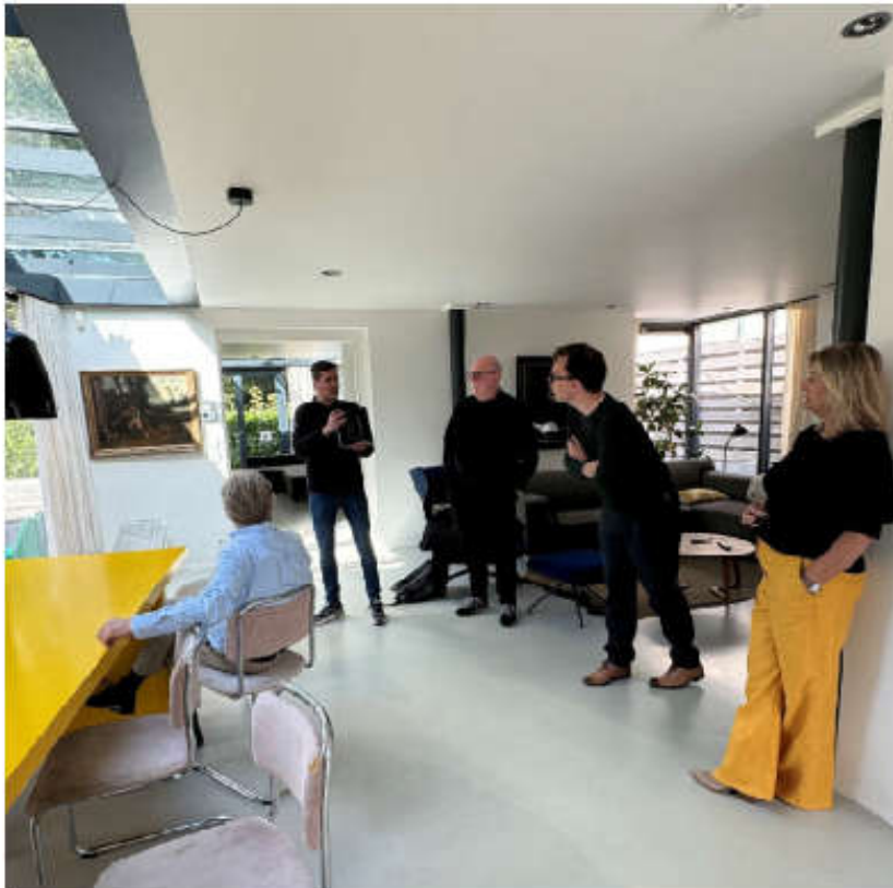
bezichtiging Woonhuis Schöne

Overigens zijn de Vrienden zonder kosten of met aantrekkelijke kortingen welkom bij alle publieksactiviteiten van het RKD, zoals bij symposia die het RKD in eigen huis organiseert. Zo trok het ESNA Winterseminar in samenwerking met ESNA 63 deelnemers, het symposium Papierknipkunst 70 deelnemers en het symposium Art on Demand 65 deelnemers. Verder verzorgde het RKD in eigen huis onder meer lezingen, workshops, studiedagen en presentaties van nieuw verschenen RKD Studies. Op 10 oktober 2024 opende de nieuwe tijdelijke tentoonstelling Herdenkingsmonumenten: Bevrijding in beeld , om de gedigitaliseerde beeldhouwersarchieven onder de aandacht te brengen.