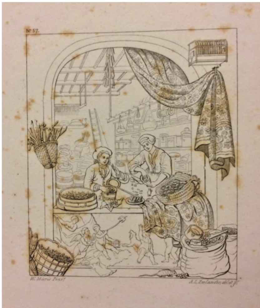
Prent 'Steengracht' met shade

De prentenseries 'Steengracht' en 'Souvenir Arnz' zijn belangrijke voorbeelden van vroege reeksen illustraties van een museale collectie, bestemd voor een breder, kunstminnend publiek en gepubliceerd toen musea in Nederland nog een tamelijk nieuw verschijnsel waren. Op basis van de gekozen selectie van de uitgebeelde kunstwerken kunnen de prentenreeksen antwoord geven op de vraag welke werken uit de collectie van het Mauritshuis als hoogtepunten werden beschouwd. De reeks geeft inzicht in collectie-, canonvorming en de behoefte om de bekendheid van een museale collectie te vergroten in de vroege negentiende eeuw, en in het Mauritshuis in het bijzonder. De prentenseries zijn tot op heden vrijwel niet onderzocht.