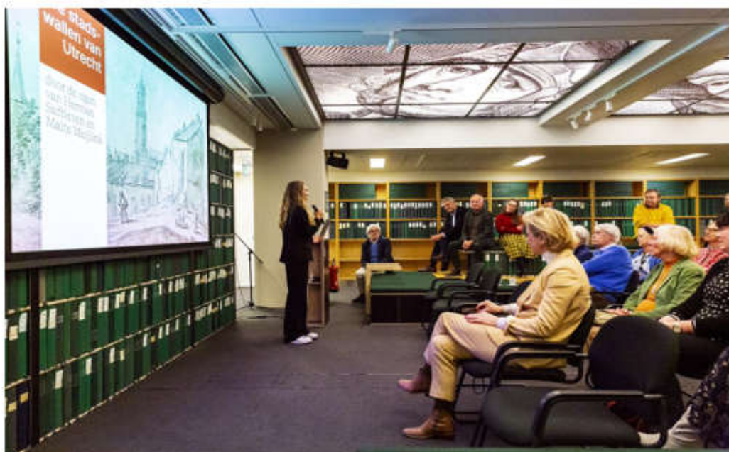
Opening Saftleven-tentoonstelling in het RKD