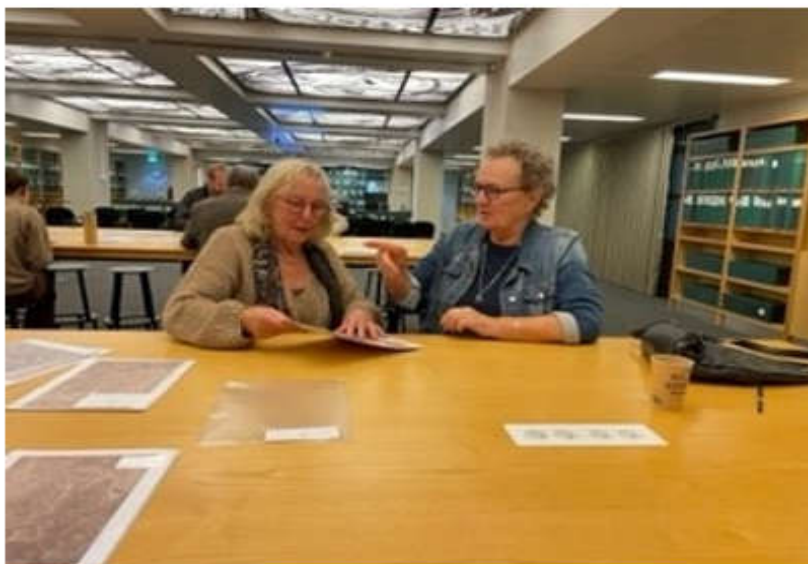
Masterclass 'Herken de Hand' tijdens het Weekend van de Wetenschap

Overigens zijn de Vrienden zonder kosten of met aantrekkelijke kortingen welkom bij alle publieksactiviteiten van het RKD. In 2022 werden zij speciaal uitgenodigd voor: