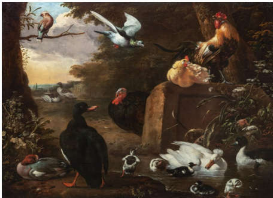
Melchior d'Hondecoeter, Landschap met een duif, haan en hen en verschillende watervogels, ca. 1658-1667, olieverf op doek, 133 x 144,5 cm, Nederland, particuliere collectie.