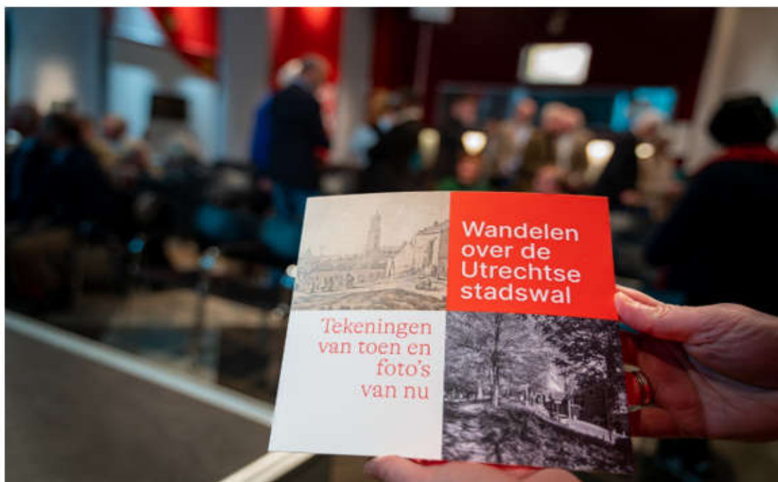
Presentatie publieksboek Saftleven in Het Utrechts Archief op 25 november.

Het boek, dat met name in Utrecht gretig aftrek vond en vindt, werd op 25 november gepresenteerd in Het Utrechts Archief. Op de drukbezochte bijeenkomst mochten we ook veel Vrienden ontvangen. Voor hen lag uiteraard een exemplaar klaar, terwijl Vrienden die niet aanwezig waren in het RKD een exemplaar konden (en kunnen) afhalen.