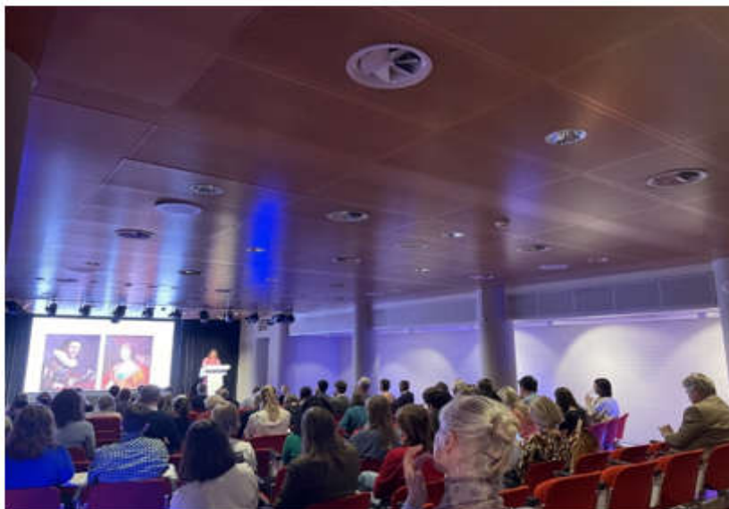
Symposium 'Close Encounters' op 22 en 23 september 2022

Op 22 en 23 september 2022 vond het hybride symposium 'Close Encounters: Cross-Cultural Exchange between the Low Countries and Britain 1600-1800' plaats in het RKD – Nederlands Instituut voor Kunstgeschiedenis in Den Haag. De aanleiding was de lancering van de rijk geannoteerde en geïllustreerde digitale Engelse versie van Horst Gersons hoofdstuk over Groot-Brittannië uit zijn Ausbreitung und Nachwirkung der holländischen Malerei des 17. Jahrhunderts uit 1942 (in de Engelse vertaling Dispersal and Legacy of Dutch Painting of the 17th Century ).