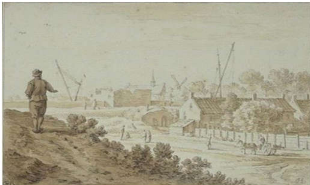
Herman Saftleven, Het Paardenveld , circa 1663, zwart krijt, penseel in grijs, 108 x 153 mm, Brussel, Koninklijke Musea voor Schone Kunsten van België, Collectie De Grez

Het RKD pakte in 2022 groot uit met Herman Saftleven (1609-1685). Van geen enkele zeventiende-eeuwse kunstenaar zijn zoveel realistische gezichten van de ommuring van een stad in de Nederlanden bekend.